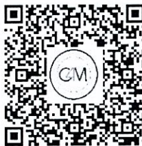
วิธีที่ค้นแนะนำ การใช้งานระบบ C4M